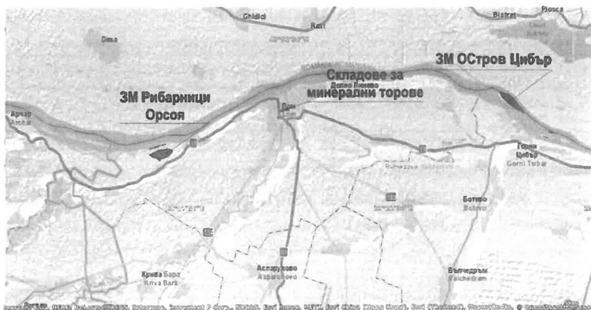
Фигура 4-3 Карта с нанесени граници на складовете за тор и най-близките защитени територии

Инвестиционното предложение не засяга територии на защитени зони по смисъла на Закона за биологичното разнообразие или защитени територии по смисъла на Закона за защитените територии. Не се очаква въздействие върху популации на видове, предмет на