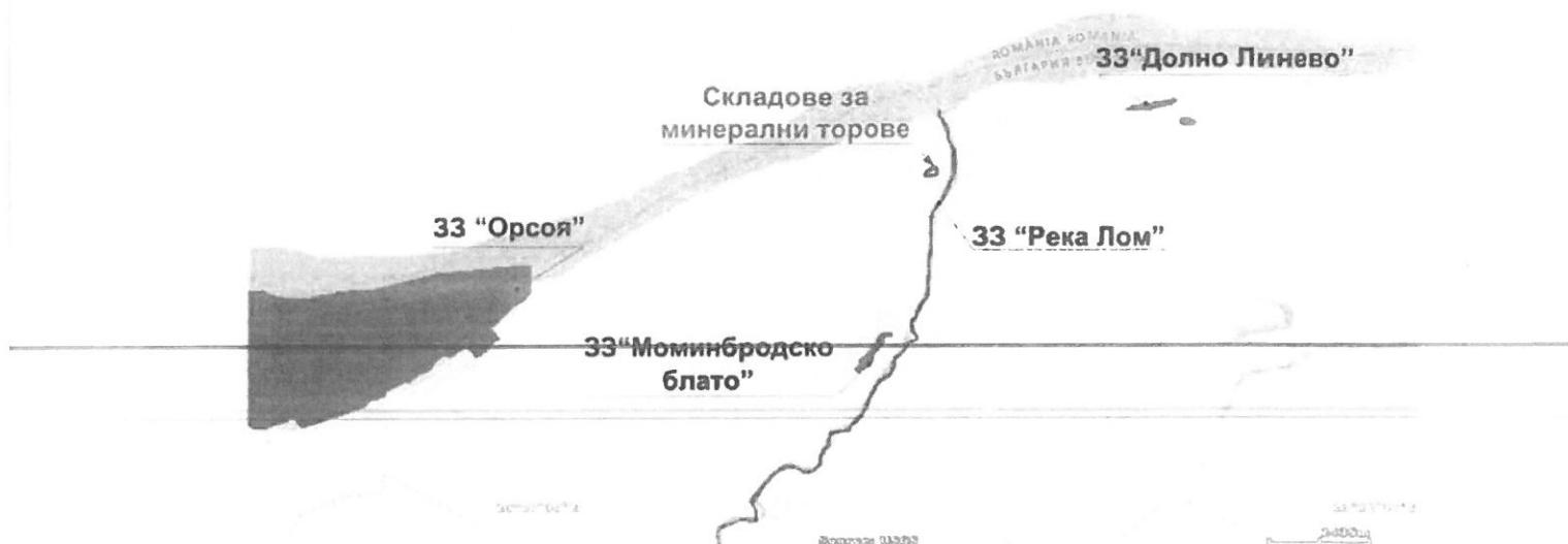
Фигура 4-2 Карта с нанесени граници на складовете за тор и най-близките защитени зони

Най-близките защитени територии по смисъла на Закона за защитени територии до обекта са следните (вж. фигура 4-3):