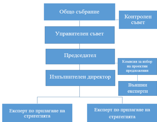
ОРГАНИЗАЦИОННА СТРУКТУРА (СХЕМА)

Организационна структура и механизма за вземане на решения е уреден в Устава на Сдружението, приложен към настоящата стратегия.